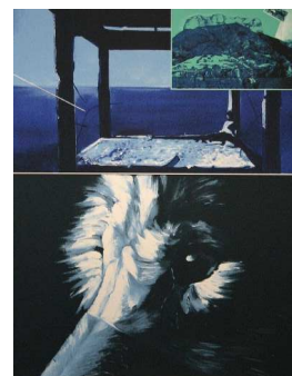
Jacques Monory Sans titre , 2004 Sérigraphie, 80 ex.

Les publications et éditions sont en vente à la boutique de la fondation ou par correspondance. La liste des catalogues et estampes disponibles peut-être consultée sur le site Internet de la fondation.