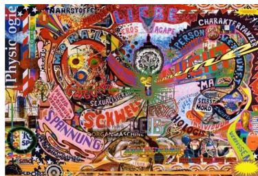
Oliver Ross Analyse Diplom 2007 Tirage offset, 60 ex.