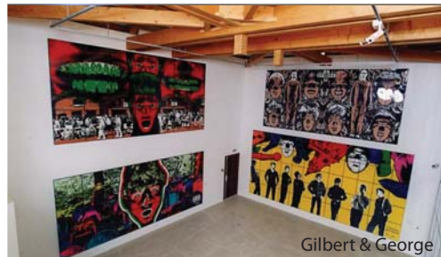
Gilbert & George