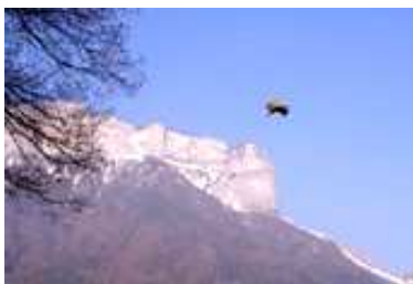
Peter Wüthrich Imago , 2006 Photographie contrecollée sur dibbond, 60 ex.