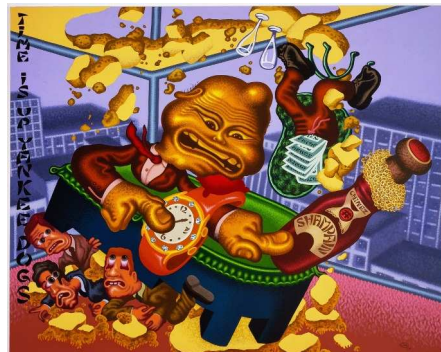
Chinese Businessman Lands on Wall Street, 2006, acrylique sur toile, 198 x 244 cm, photo : courtesy of David Nolan Gallery, New York

Sept-Oct-Nov : ouvert du jeudi au dimanche de 14h à 19h.