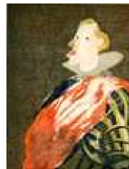
Gaël Davrinche Philippe IV , 2007 Gravure, 60 ex.