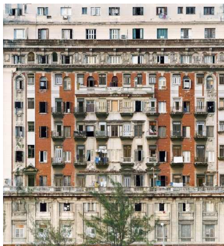
Série « Melting Point » - La Havane n° 4, 2007 C-print, Ed. 5 180 x 163 cm