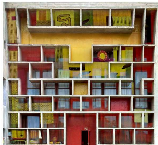
Série Chandigarh Replay - Chandigarh - Haute cour de justice n°1, 2006-2007 C-print, Ed. 3 180 x 198 cm