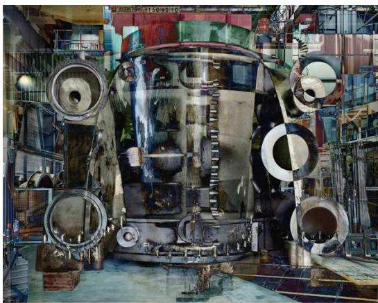
Série Melting Power - Usine Alstom - Belfort Photo n°2, 2009 C-print 180 x 230 cm