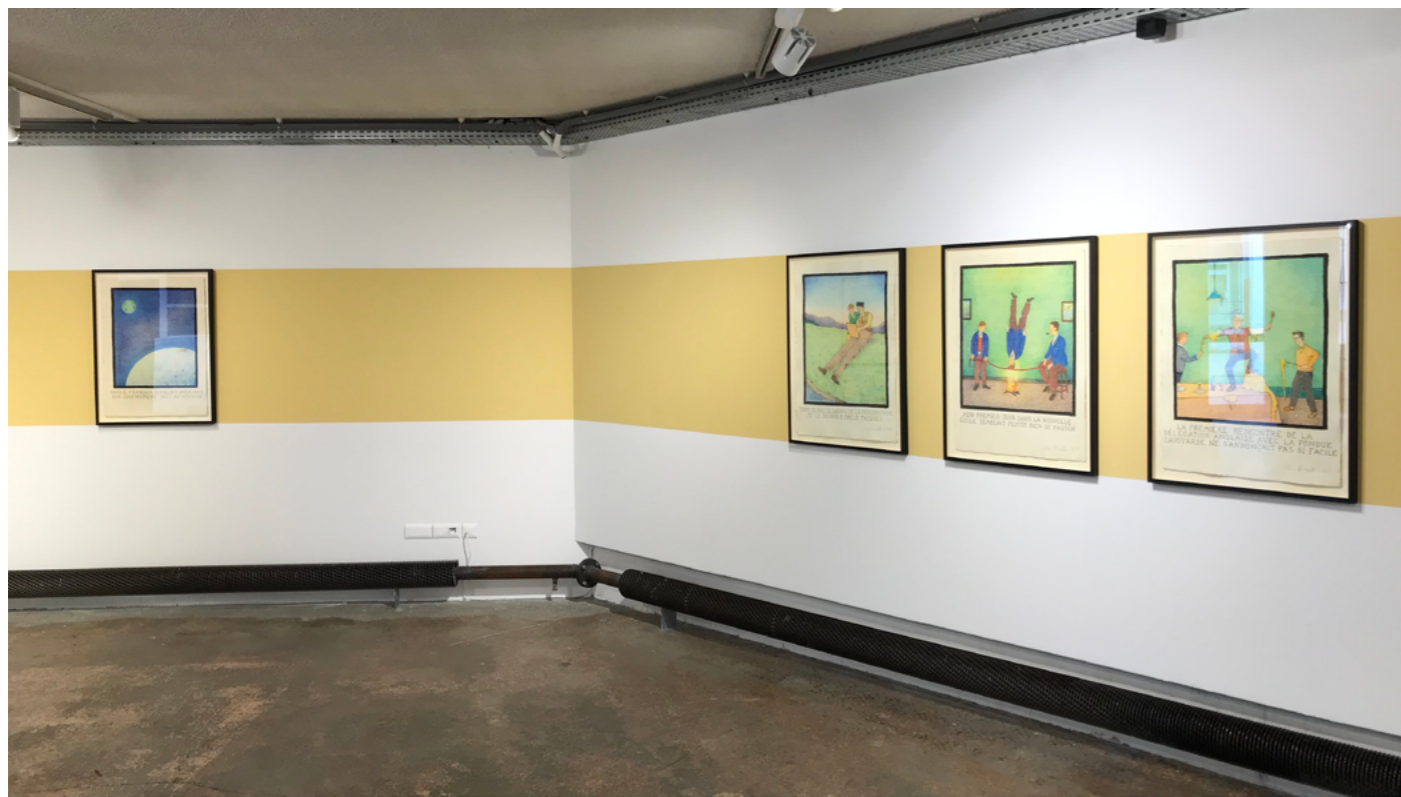
Vue de l'exposition « Absolutely Baxter » - Glen Baxter - 15 avril - 16 septembre 2023 La FabriC - espace d'exposition de la Fondation Salomon, Annecy