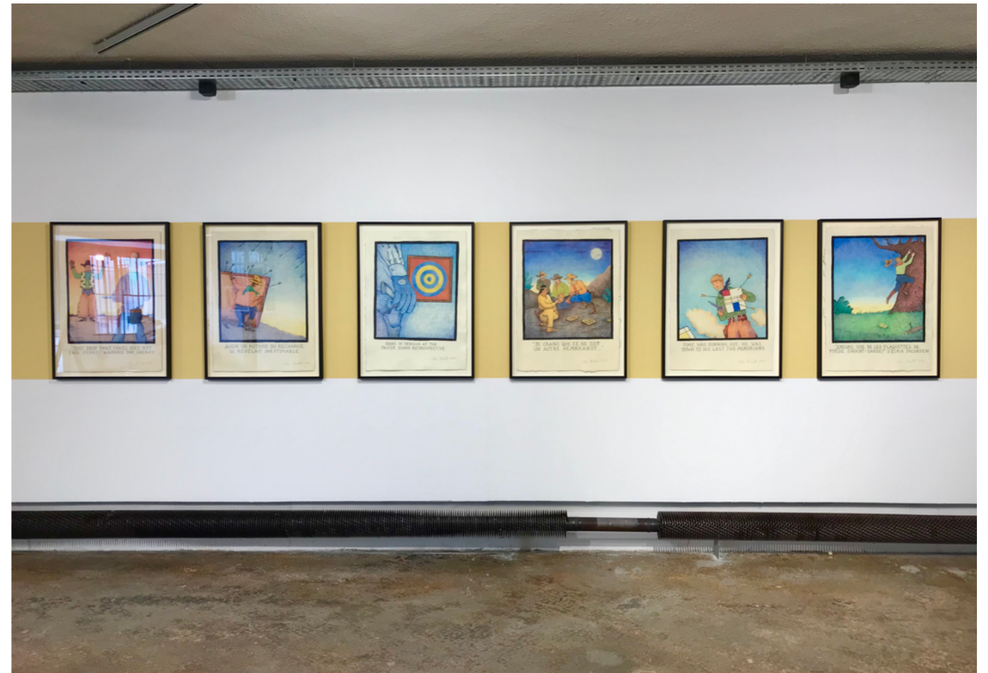
Vue de l'exposition « Absolutely Baxter » - Glen Baxter - 15 avril - 16 septembre 2023 La FabriC - espace d'exposition de la Fondation Salomon, Annecy