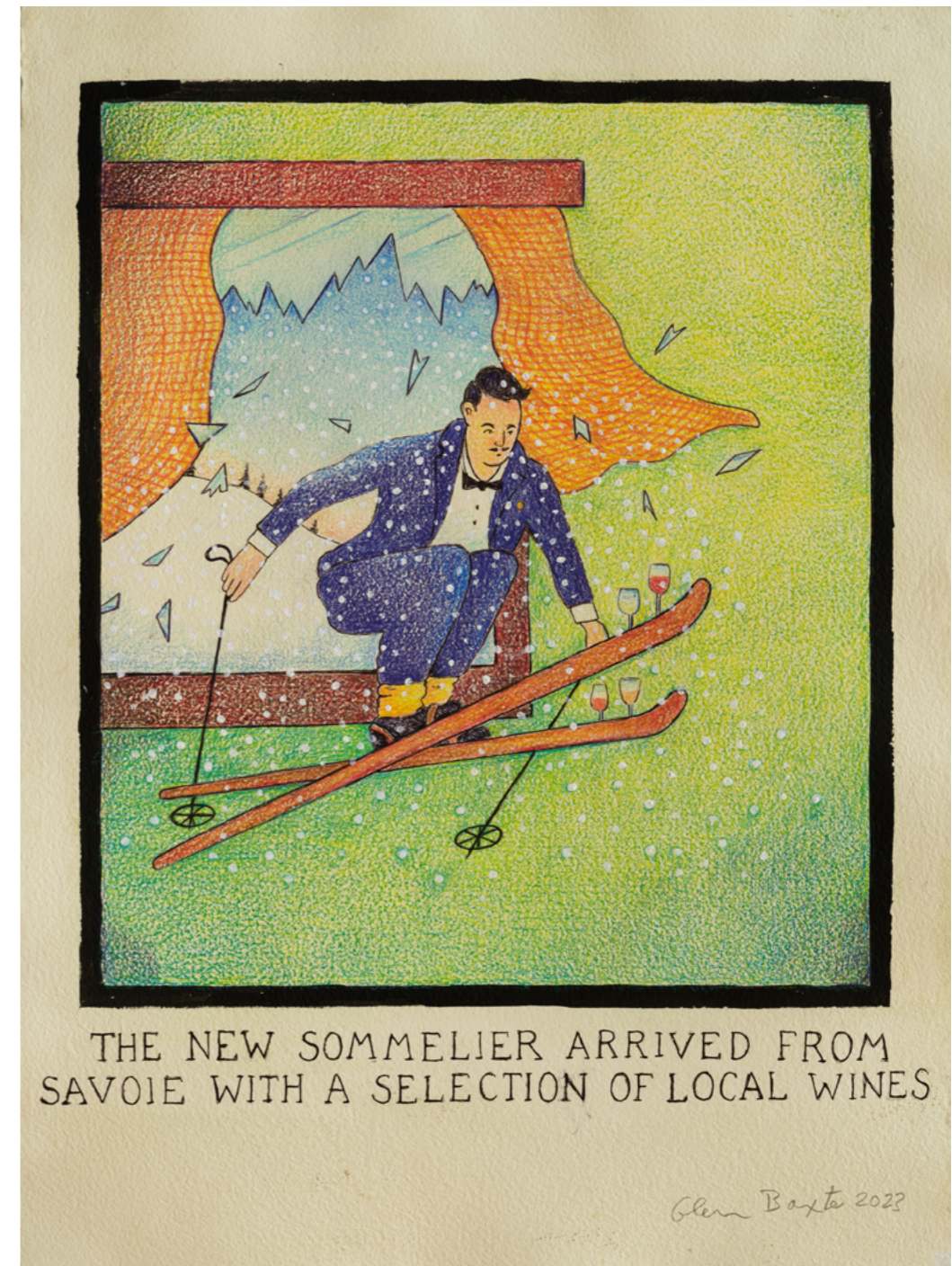
Glen Baxter, The new sommelier arrived from Savoie with a selection of local wines, 2023, encre et crayon sur papier, 79 x 53 cm

Visite de l'exposition en Langue des Signes Française - 9 septembre 2023