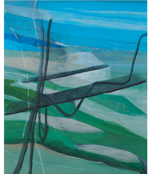
Sans Titre , 2022 Huile sur toile, 55 x 46 cm © Marc Desgrandchamps ADAGP, Paris 2023