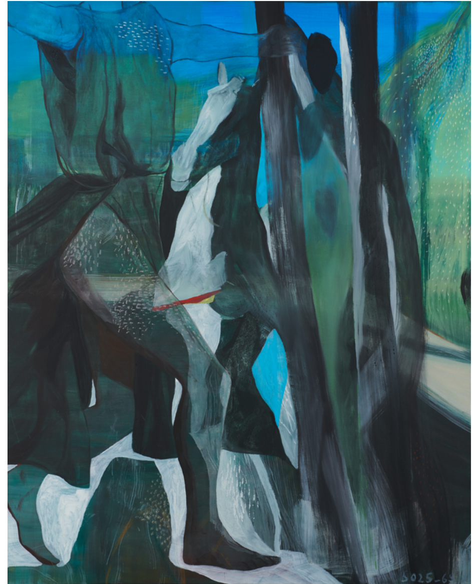
Isadora Duncan , 2023 Huile sur toile, 162 x 130 cm © Marc Desgrandchamps ADAGP, Paris 2023 Courtesy Galerie Lelong & Co. Paris