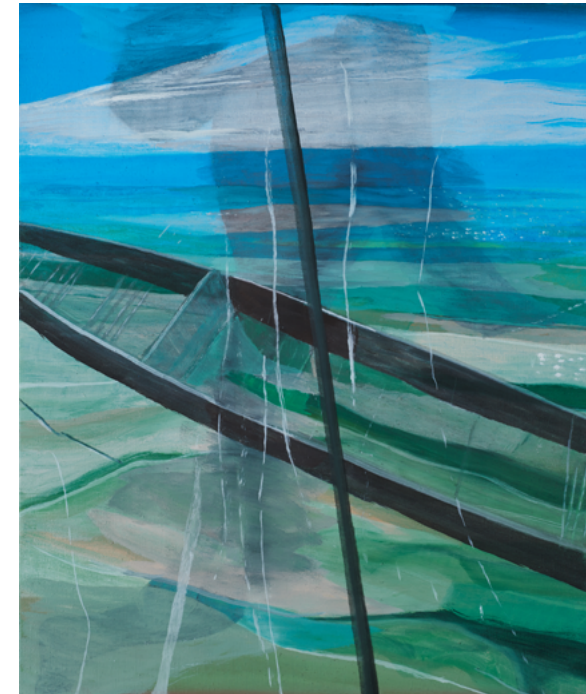
La Barque , 2022 Huile sur toile, 55 x 46 cm © Marc Desgrandchamps ADAGP, Paris 2023 Courtesy Galerie Lelong & Co. Paris