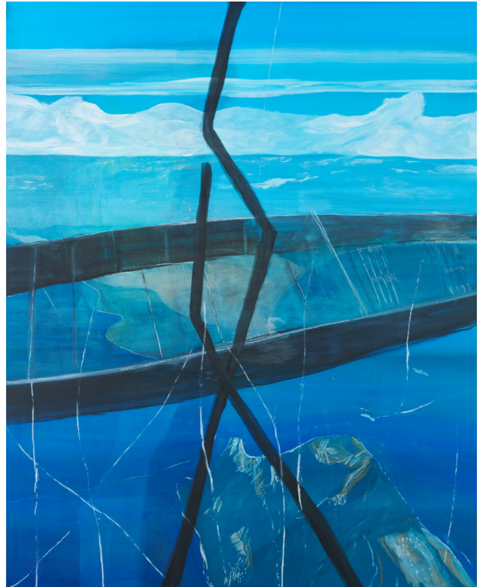
Accident , 2022 Huile sur toile, 162 x 130 cm © Marc Desgrandchamps ADAGP, Paris 2023 Courtesy Galerie Lelong & Co. Paris