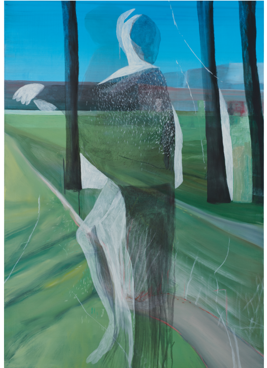
Sans Titre , 2023 Huile sur toile, 162 x 114 cm © Marc Desgrandchamps ADAGP, Paris 2023 Courtesy Galerie Lelong & Co. Paris