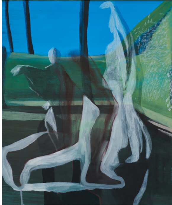
Sans Titre , 2023 Huile sur toile, 55 x 46 cm © Marc Desgrandchamps ADAGP, Paris 2023 Courtesy Galerie Lelong & Co. Paris