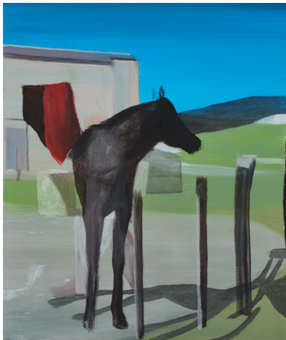
Sans Titre , 2023 Huile sur toile, 55 x 46 cm © Marc Desgrandchamps ADAGP, Paris 2023 Courtesy Galerie Lelong & Co. Paris