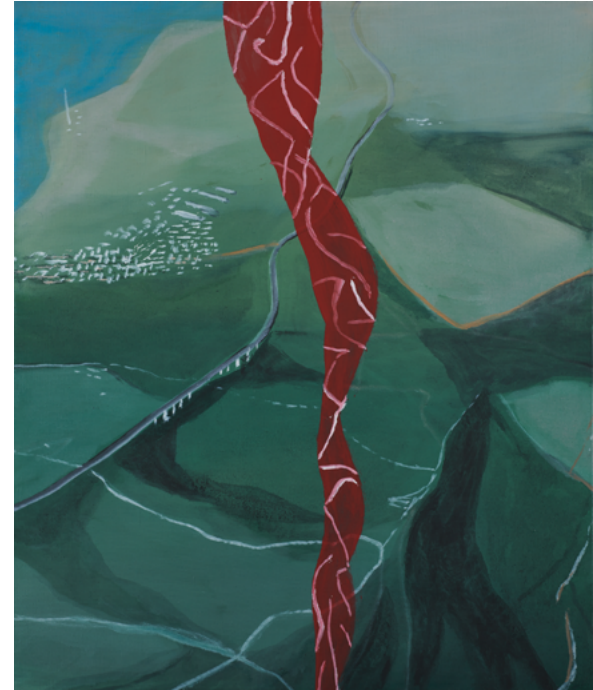
La Fracture , 2023 Huile sur toile, 55 x 46 cm © Marc Desgrandchamps ADAGP, Paris 2023 Courtesy Galerie Lelong & Co. Paris