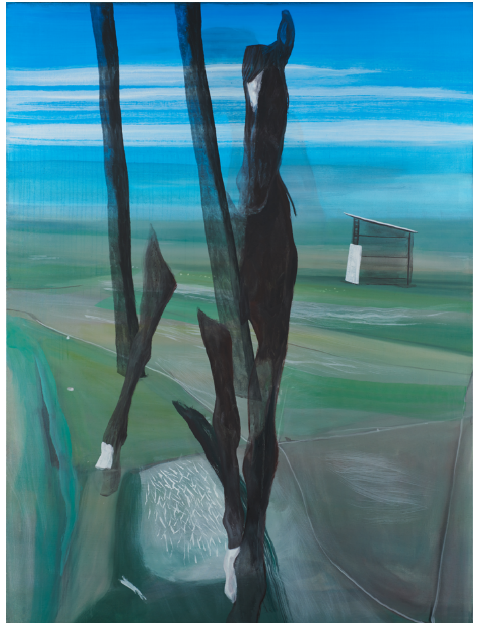
A l'Heure dite , 2023 Huile sur toile, 200 x 150 cm © Marc Desgrandchamps ADAGP, Paris 2023