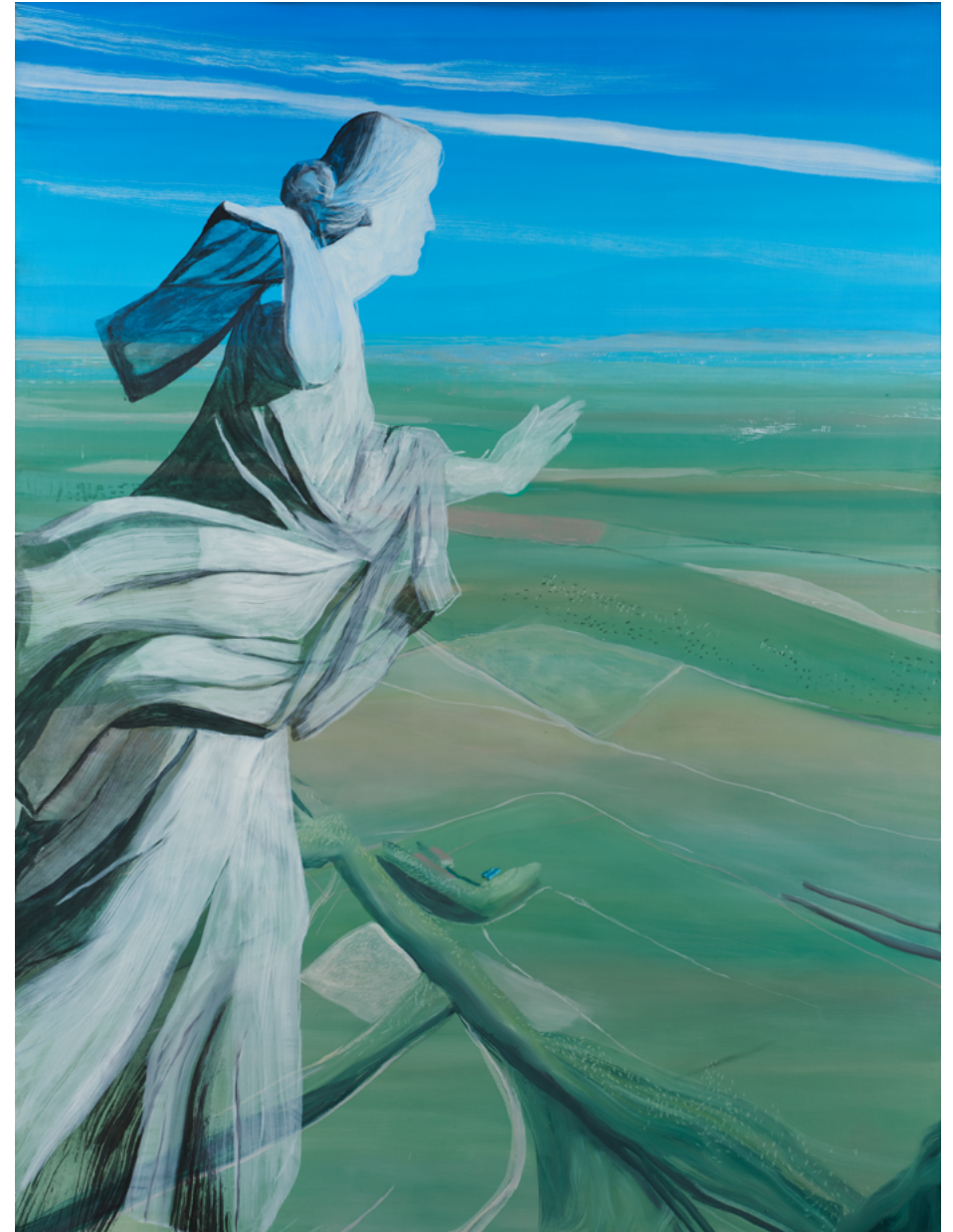
Le Jour , 2022